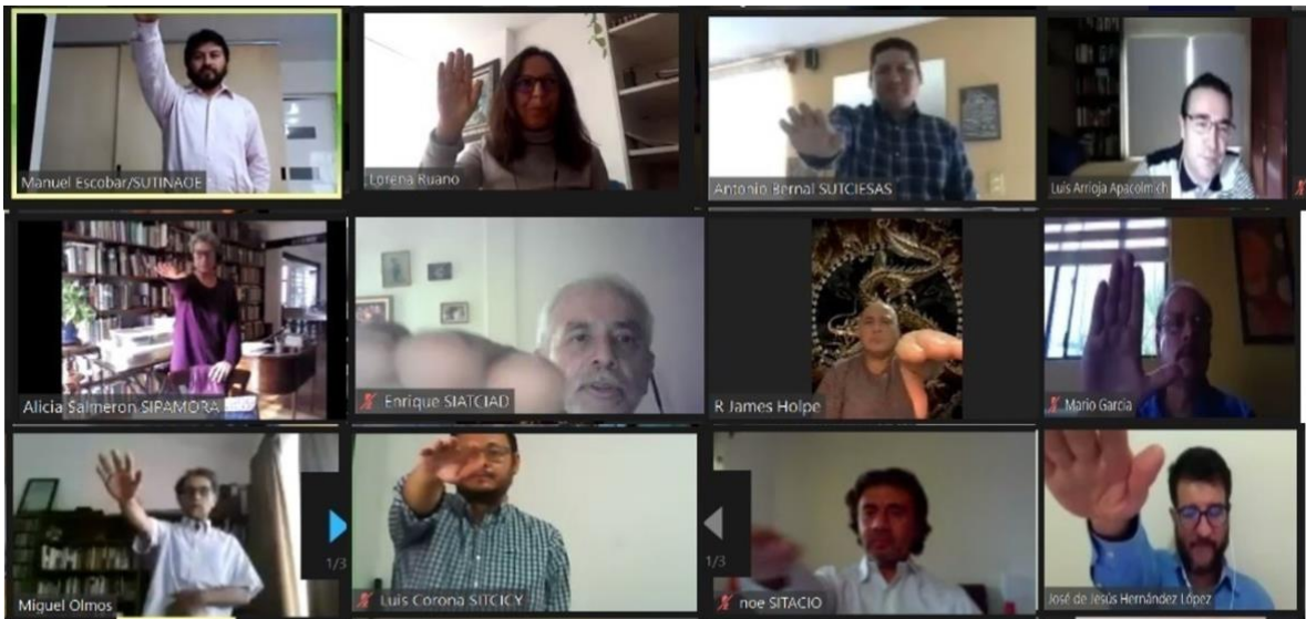
TOMA DE PROTESTA DE LA COORDINACIÓN EJECUTIVA DE LA FENASSCYT 20 DE AGOSTO DE 2020

Al final del acto los Secretarios Generales rindieron protesta en cada uno de sus cargos.